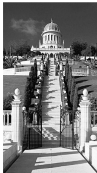
O Sepulcro do Báb, Haifa, Israel