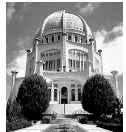
Bahá'í Temple, près de Chicago